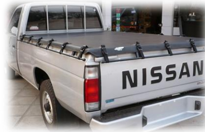
CARROCERIA ABIERTA (PICK UP)